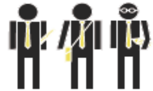
Les partenaires associés

Tout au long de la procédure, les Personnes Publiques Associées, dites «PPA», (État, Région, Département, Chambre d'Agriculture, Communauté de Communes, Communes environnantes ...) sont également sollicitées pour donner des avis et émettre des recommandations sur le projet du territoire.